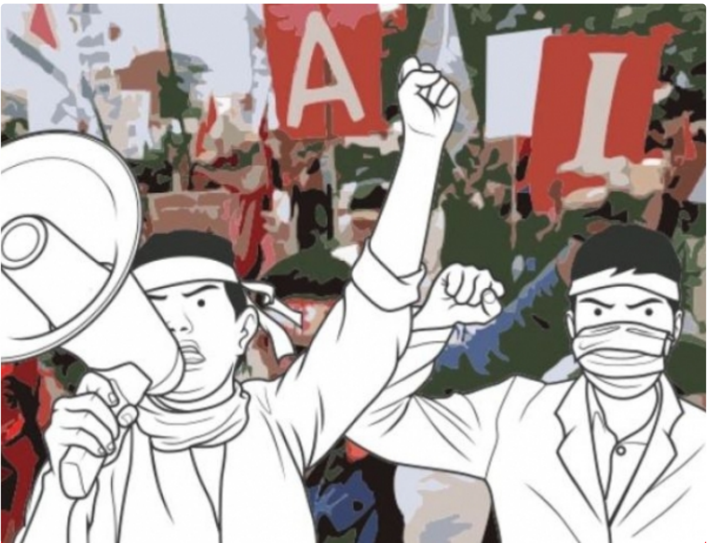
Ilustrasi Gambar Demo Masyarakat

PALANGKA RAYA - Paska divonis bebasnya bandar besar Narkoba, Salihin Bin Abdulah alias Saleh beberapa waktu oleh Majelis Hakim Negeri Pengadilan (PN) Palangka Raya, menuai kontroversi dan kecamatan masyarakat, khusus kota Palangka Raya.