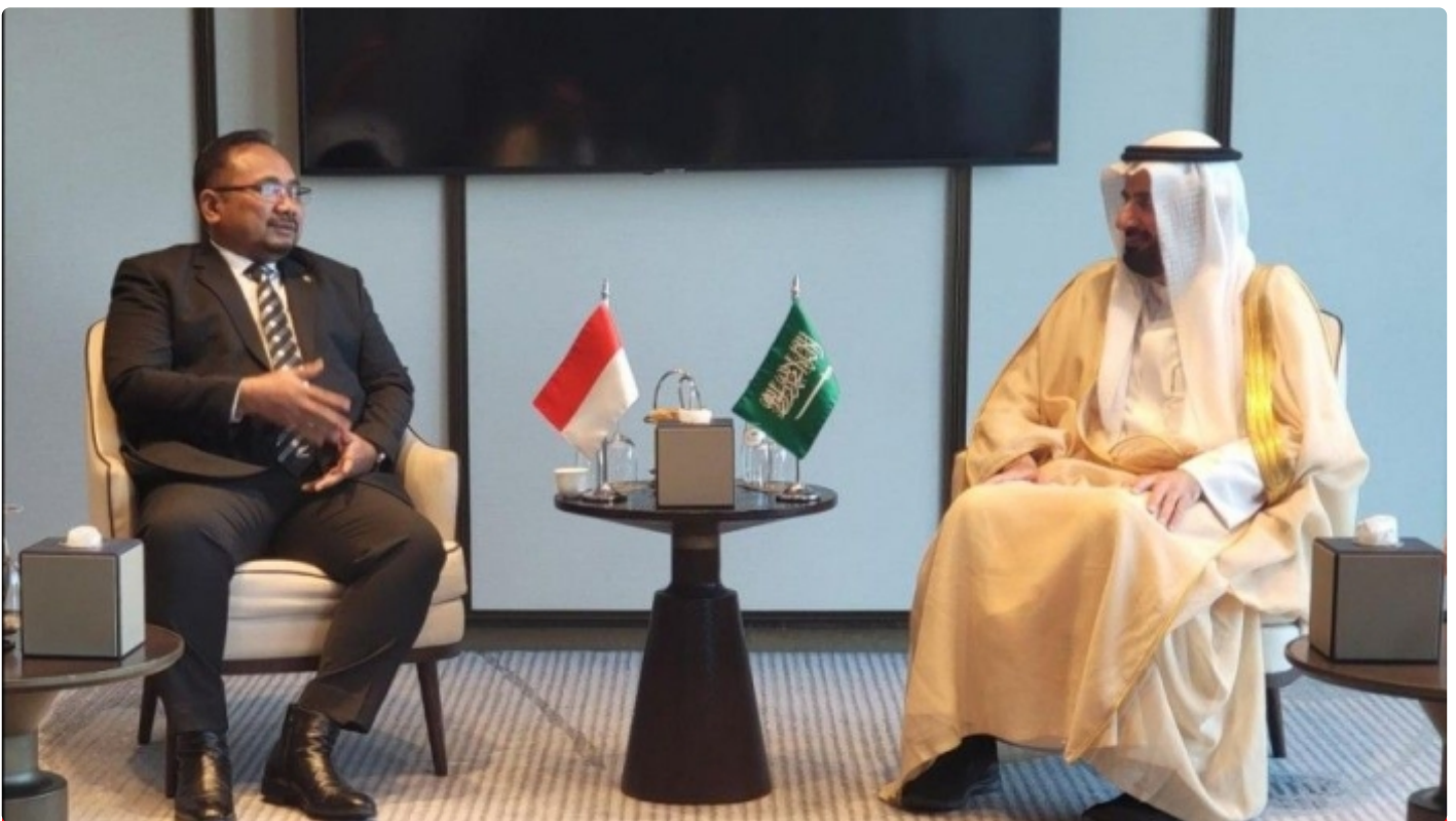
Menag Yaqut bertemu Menteri Haji Arab Saudi Tawfiq F. Al Rabiah, di Jeddah.

JAKARTA - Indonesia dan Pemerintah Kerajaan Arab Saudi telah menandatangani kesepakatan penyelenggaraan ibadah haji 1444 H/2023 M. Kesepakatan tersebut ditandatangani hari ini oleh Menag Yaqut Cholil Qoumas bersama Menteri Haji dan Umrah Arab Saudi Tawfiq F Al Rabiah di Jeddah.