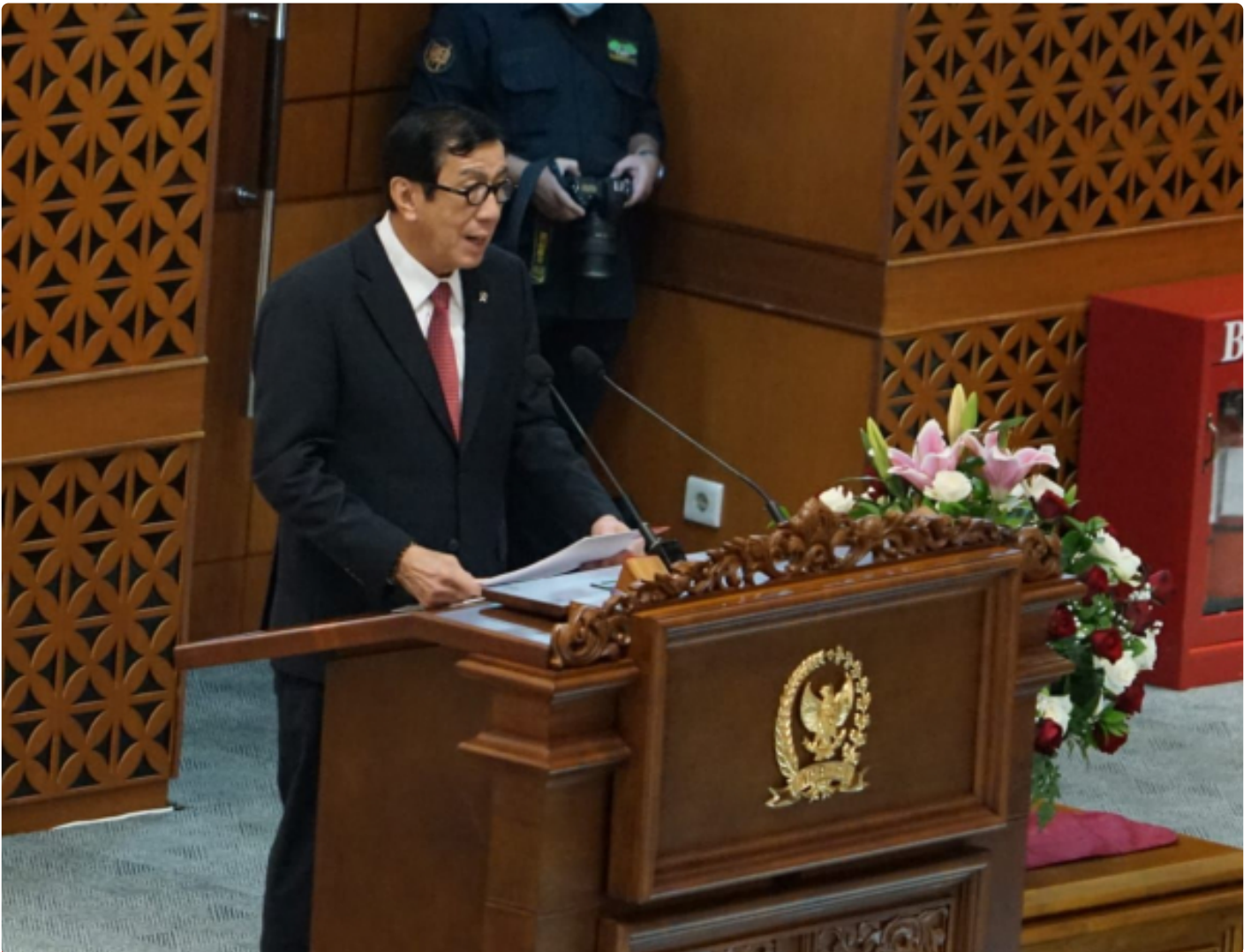
Menkumham Yasonna Laoly: UU Pemasyarakatan untuk Perkuat Keadilan Restoratif

JAKARTA – Menteri Hukum dan HAM Yasonna H. Laoly mengapresiasi semua pihak yang berperan dalam pengesahan Rancangan Undang-Undang tentang